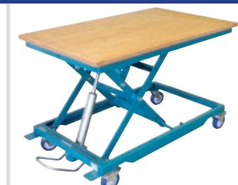
NIVEAU HS 300-midi mit Plattformschwenkrahmen