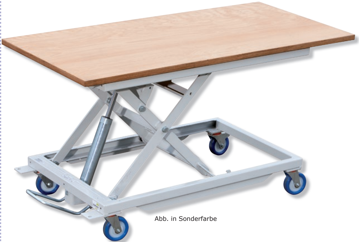
Abb. in Sonderfarbe

Der höhenverstellbare Arbeitstisch HS 300-midi bietet mit seiner Tragkraft von 300 kg und der - gegenüber seinem kleineren Bruder - größeren Plattform, ein breites Einsatzspektrum.