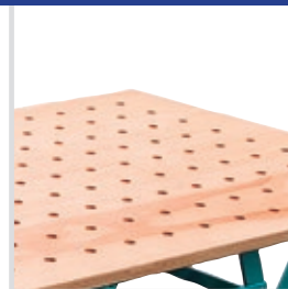
Abb. in Sonderfarbe

Eine Buchen-Multiplex-Arbeitsplatte mit glatter Oberfläche oder als Lochrasterplatte, lässt sich mit wenigen Handgriffen auf den Plattformrahmen montieren.